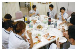
タバコについて語る会